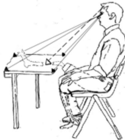
Abb. 2: Verkrüppelter Phantomunterschenkel auf dem Tisch

Um den Phantomschmerz in der Fußsohle mit einzubeziehen, erweitere ich in späteren Zyklen die Schritte 2 und 3 durch Krallen und Spreizen der Zehen in verschiedenen Kombinationen mit dem Strecken-Entspannen und Hochziehen-Entspannen des Fußes. Das verlangsamt zuerst die Zyklen. Um deren spontane Beschleunigung wieder zu ermöglichen, werden kombinierte Instruktionen wie „Strecken des Fußes und Krallen der Zehen“ und „Hochziehen des Fußes und Spreizen der Zehen“ zusammengezogen in „Runter“ und „Rauf“. Da diese Änderungen in die laufende Erfahrung eingebettet sind, werden sie als selbstverständlich akzeptiert.